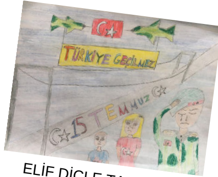
ELİF DİCLE TAŞDAN 6B