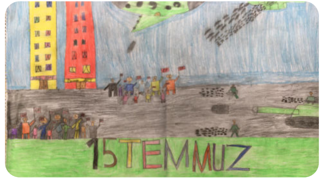
EFE TAŞDAN 6B