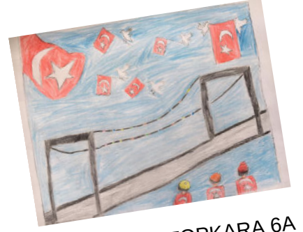
BEYTULLAH TOPKARA 6A