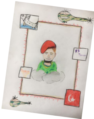
ELÇİN BAKİ 5B