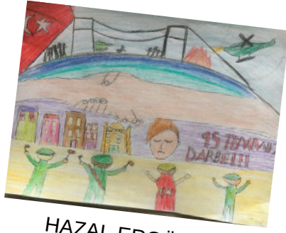
HAZAL ERGÜL 6B