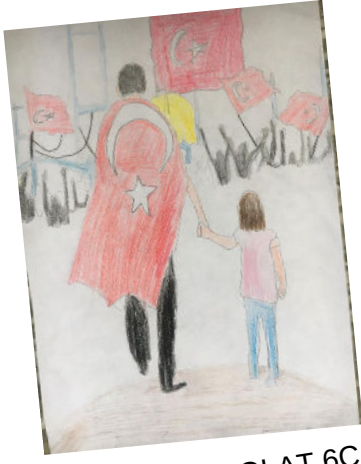
İCLAL CANPOLAT 6C