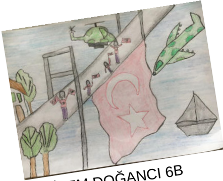
GİZEM DOĞANCI 6B