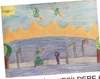
HAYRUNNİSA YEŞİLDERE 6B