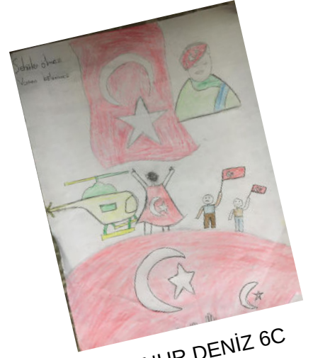
İLKNUR DENİZ 6C