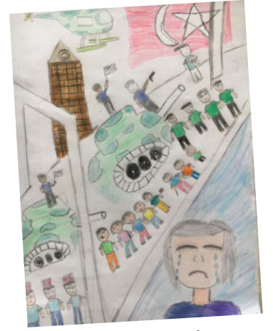
BÜŞRA RUTÇİ 6C