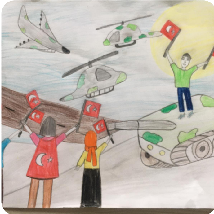
ECRİN KIR 6B

Bir çağ idi geldi geçti 15 temmuz Kazındı hafızalarımıza Milletimin cesurlukları Kimi panzerin önüne yattı Kimi kurşunlara siper etti gövdesini Başaramadı darbeciler gayesini Dünya gördü Türk'ün cesaretini Kabul etmez kimsenin esaretini Tank da silah da hiç bir şey durduramaz İnanmış Türk Milletini Asla korkutamaz