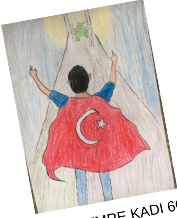
YUNUS EMRE KADI 6C