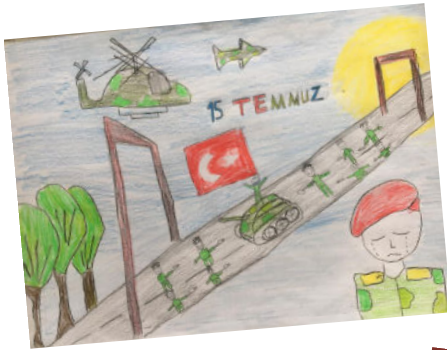
BATUHAN ÇİFCİ 6B