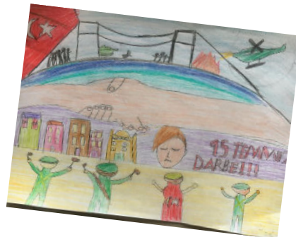
HAZAL ERGÜL 6B