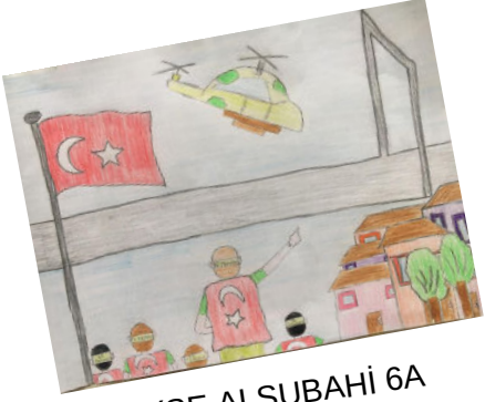
AYŞE ALSUBAHİ 6A