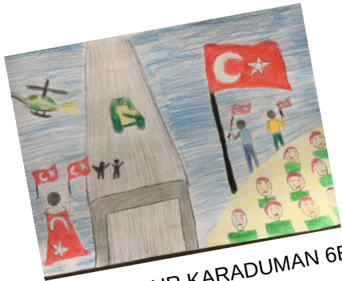
FUNDANUR KARADUMAN 6B