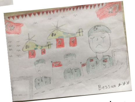
BESSAM AL GBURİ 6A