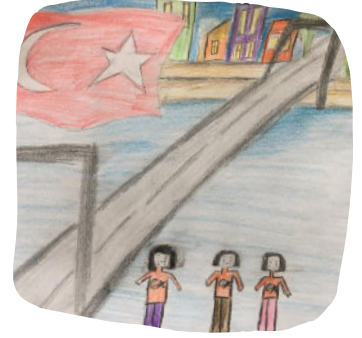
YAĞMUR NİSAN SERT